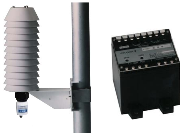
・ K5603AS 温度湿度計感部 ・ K5603AR 通風筒 (鉄塔は別売り)

出力信号 : 温度 ; Pt 100\text{ }\Omega 測温抵抗体の抵抗信号 湿度 ; DC 0\text{ V} \sim 5\text{ V} および 0\text{ mV} \sim 10\text{ mV} / 0\% \sim 100\% \text{ r.h.} 出力インピーダンス ; 0\text{ V} \sim 5\text{ V} \cdots 1\text{ }\Omega 以下, 0\text{ mV} \sim 10\text{ mV} \cdots 100\text{ }\Omega 電源 : DC 12\text{ V} ( 10.5\text{ V} \sim 16.5\text{ V} ) , 約 20\text{ mA} 使用環境 : -20\text{ }^{\circ}\text{C} \sim +50\text{ }^{\circ}\text{C} , 0\% \sim 90\% \text{ r.h.} 材質 : ケース ; プラスチック (黒) 外形寸法 : 115\text{ mm (W)} \times 117\text{ mm (H)} \times 127\text{ mm (D)} 質量 : 約 0.5\text{ kg}